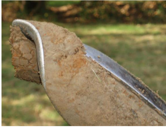
Exemple de traces d'hydromorphie dans les sols

Les résultats de cet inventaire ne peuvent cependant être considérés comme exhaustifs. Le seul inventaire pouvant faire foi est celui de la police de l'Eau.