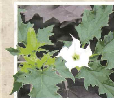
LE DATURA STRAMOINE

Crédits photos et création : FREDON Bretagne - Juillet 2017 - NE PAS JETER SUR LA VOIE PUBLIQUE