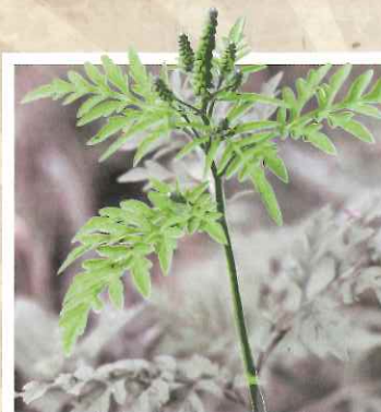
L'AMBROISIE À FEUILLES D'ARMOISE

COMMENT LES RECONNAÎTRE ? QUE FAUT-IL FAIRE ?